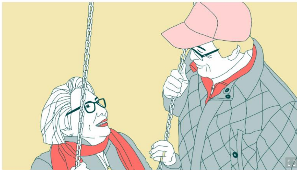
Aldersvennlig samfunn